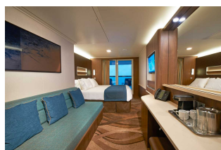
Kabina z balkonem