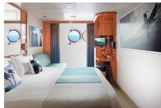
Kabina z oknem

Już od 2538 € w cenie podatki i opłaty portowe