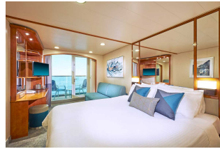
Kabina z balkonem