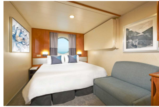
Kabina z oknem