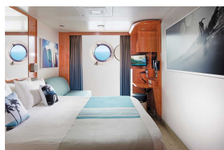
Kabina z oknem

Już od 2154 € w cenie podatki i opłaty portowe