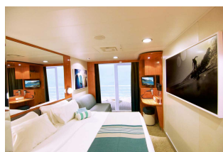
Kabina z balkonem

Już od 2766 € w cenie podatki i opłaty portowe