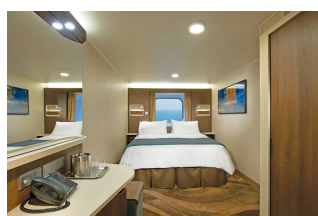
Kabina z oknem

Już od 1019 € w cenie podatki i opłaty portowe