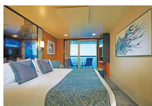
Kabina z balkonem

Już od 1440 € w cenie podatki i opłaty portowe za osobę w kabinie 2 osobowej