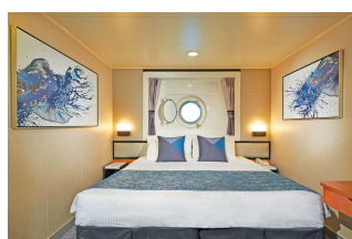
Kabina z oknem

Już od 966 € w cenie podatki i opłaty portowe za osobę w kabinie 2 osobowej