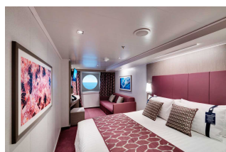
Kabina z oknem

Już od 354 € w cenie podatki i opłaty portowe