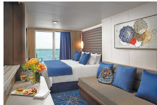
Kabina z balkonem