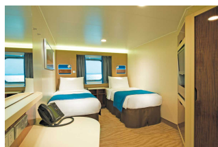
Kabina z oknem

Już od 590 € w cenie podatki i opłaty portowe