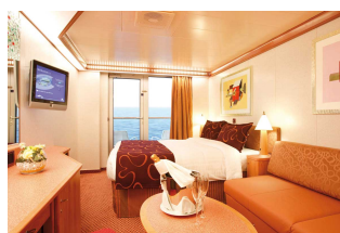
Kabina z balkonem

Już od 1299 € w cenie podatki i opłaty portowe