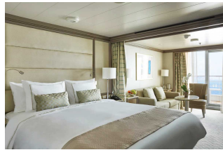
Apartament Classic Verand