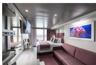
Kabina z balkonem

Już od 1253 € w cenie podatki i opłaty portowe