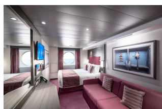
Kabina z oknem

Już od 1123 € w cenie podatki i opłaty portowe