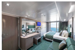
Kabina z balkonem

Już od 1063 € w cenie podatki i opłaty portowe