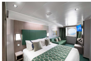
Kabina z oknem

Już od 983 € w cenie podatki i opłaty portowe