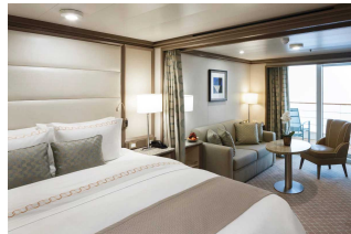
Apartament Classic Veranda

Już od 15700 € w cenie podatki i opłaty portowe