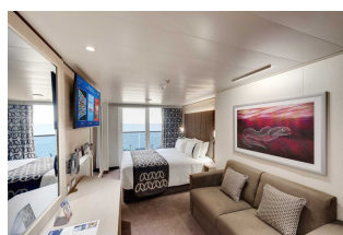
Kabina z balkonem

Już od 1219 € w cenie podatki i opłaty portowe