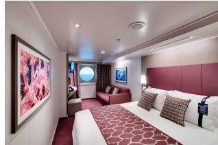
Kabina z oknem

Już od 344 € w cenie podatki i opłaty portowe