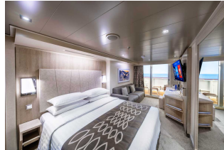
Kabina z balkonem

Już od 384 € w cenie podatki i opłaty portowe