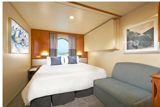
Kabina z oknem

Już od 1215 € w cenie podatki i opłaty portowe