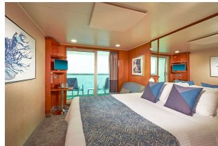
Kabina z balkonem

Już od 2215 € w cenie podatki i opłaty portowe