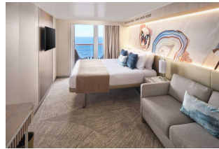
Kabina z balkonem

Już od 1761 € w cenie podatki i opłaty portowe