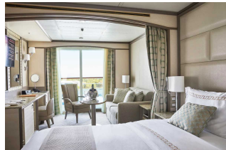
Apartament Classic Veranda

Już od 2450 € w cenie podatki i opłaty portowe