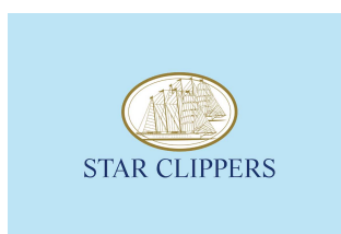
Kabina z balkonem