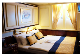
Kabina z oknem

Już od 2610 € w cenie podatki i opłaty portowe