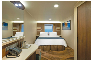
Kabina z oknem

Już od 920 € w cenie podatki i opłaty portowe