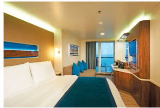
Kabina z balkonem

Już od 1323 € w cenie podatki i opłaty portowe