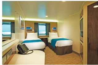
Kabina z oknem

Już od 1113 € w cenie podatki i opłaty portowe