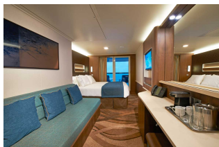
Kabina z balkonem

Już od 1140 € w cenie podatki i opłaty portowe