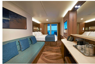
Kabina z balkonem

Już od 1210 € w cenie podatki i opłaty portowe