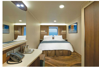
Kabina z oknem

Już od 970 € w cenie podatki i opłaty portowe