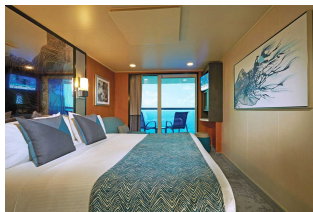
Kabina z balkonem

Już od 2565 € w cenie podatki i opłaty portowe