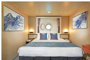
Kabina z oknem

Już od 1525 € w cenie podatki i opłaty portowe