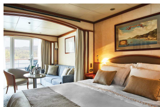
Apartament Classic Veranda

Już od 14800 € w cenie podatki i opłaty portowe