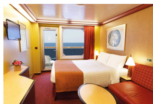
Kabina z balkonem

Już od 659 € w cenie podatki i opłaty portowe