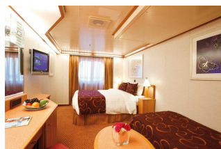
Kabina z oknem

Już od 599 € w cenie podatki i opłaty portowe