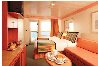
Kabina z balkonem

Już od 319 € w cenie podatki i opłaty portowe