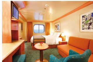
Kabina z oknem

Już od 269 € w cenie podatki i opłaty portowe