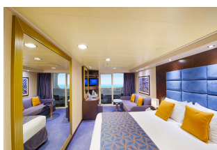
Kabina z balkonem

Już od 1073 € w cenie podatki i opłaty portowe