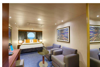
Kabina z oknem

Już od 1013 € w cenie podatki i opłaty portowe